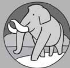
すかぞう (ナウマンゾウ)