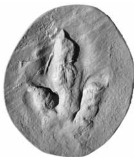
肉食恐竜の足跡グララター

ユタ州で2000年に発見された足跡化石産地。肉食恐竜の足跡化石がたくさん見つかり、約2億年前のようすが明らかになってきました。肉食恐竜がしゃがんだり、泳いだりしたことを示す化石は日本初公開！