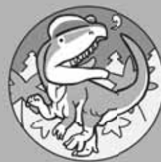
ユーくん (肉食きょうりゅう)

Fossil Footprints: Key to the Ancient World