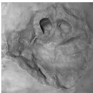
ナウマンゾウの足跡

日本で見つかった中生代の恐竜の足跡化石や、新生代のほ乳類の足跡化石を紹介します！横浜市や長野県野尻湖で見つかったナウマンゾウの足跡化石のレプリカ・写真も展示！