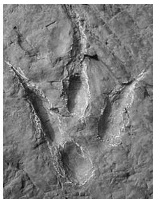
肉食恐竜の足跡アジアノボダス

ディロフォサウルス、ティラノサウルス、ディプロドクス、ステゴサウルス、トリケラトプスといった有名な恐竜の足跡化石を公開！