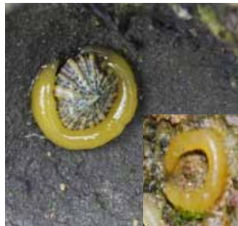
産卵中のカラマツガイ(左)と産みつけられた卵塊(右)

春の天神島では、磯の岩をよく見ると、黄色く指輪くらいの大きさの輪になったものがたくさんついています。これは巻き貝のなかまのカラマツガイの卵