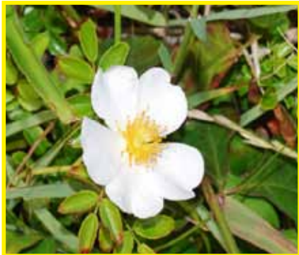
テリハノイバラ (6月)