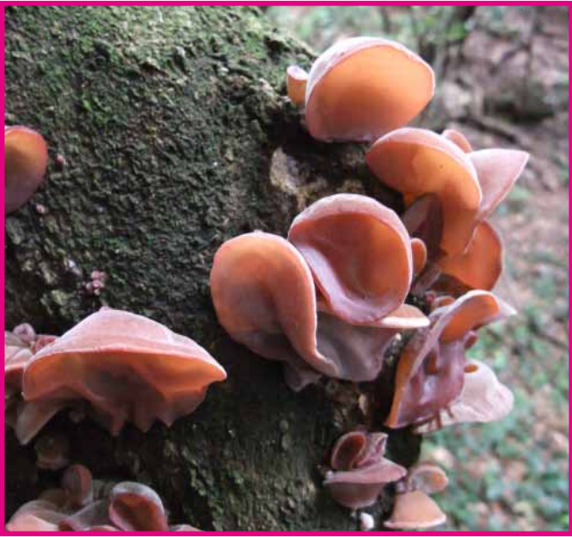
アラゲキクラゲ (4月)