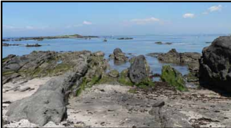
上下が逆転した地層 (通年)