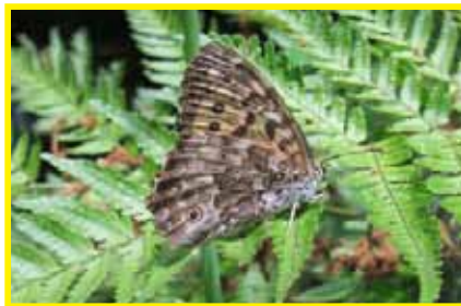
サトキマダラヒカゲ (6月)