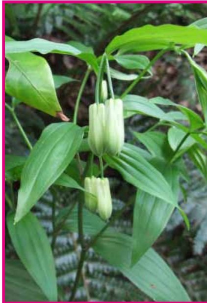
ホウチャクソウ (4月)