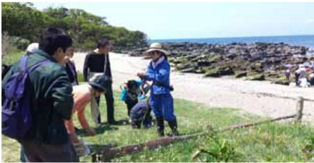
天神島ガイドツアー