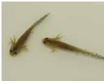
トウキョウサンショウウオの幼生

馬堀自然教育園では毎年、園内の水辺に産卵されたトウキョウサンショウウオの卵の一部を学習棟の水槽に保護し、飼育展示を行っています。今年も3月4日と5日に、そのままでは生存できないような、水質が悪い場所や水量の少ない場所などに産みつけられた卵のうを、学習棟の水槽に保護・収容しました。卵は3月末～4月初旬にかけてふ化し、ふ化した幼生は陸上生活をするようになる夏までの間、水槽内でご覧いただけます。