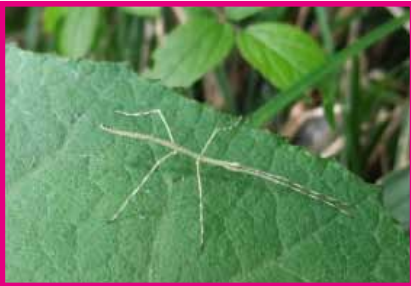
ナナフシモドキの幼虫 (4月)