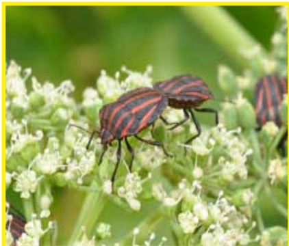
アカスジカメムシ (6月)