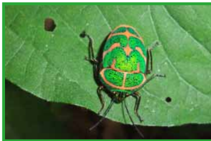
アカスジキンカメムシ (5月)