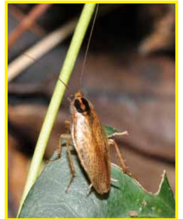
モリチャバネゴキブリ (6月)