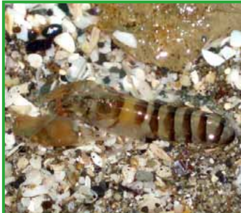
スネトゲテップウエビ (5月)